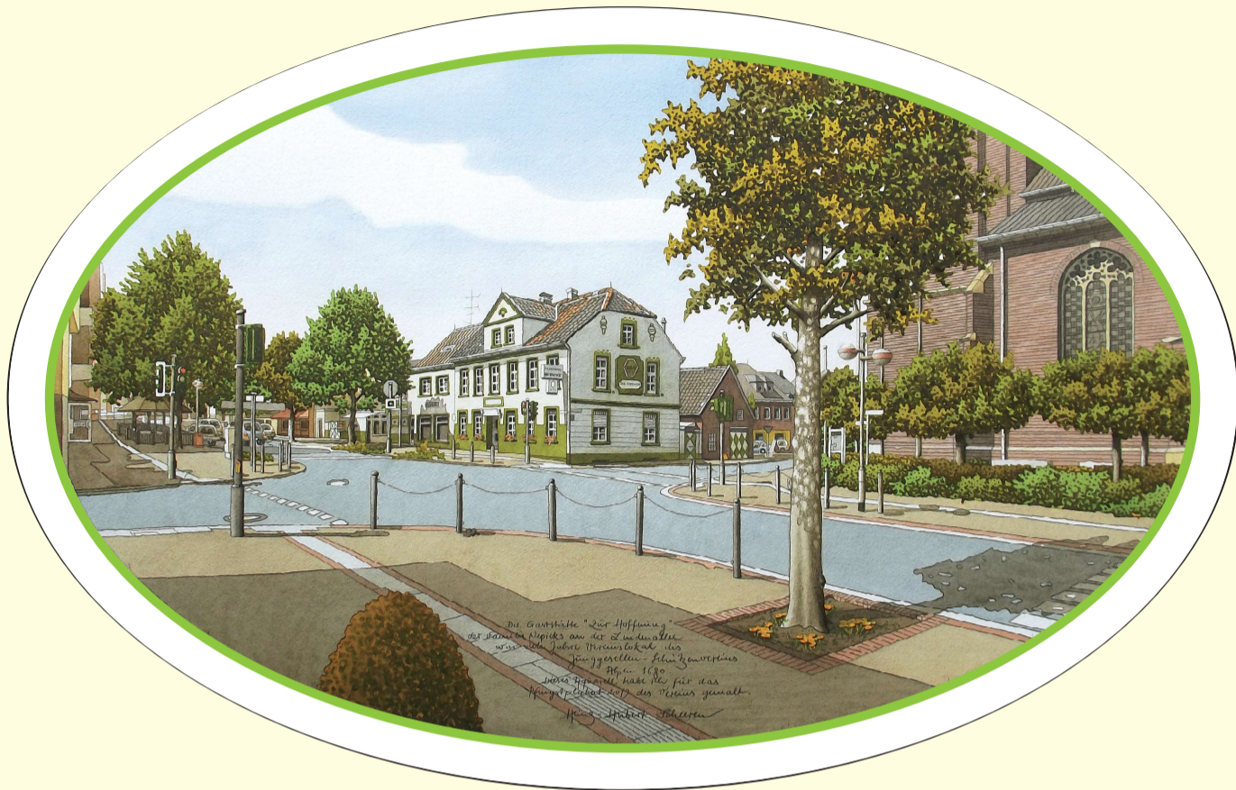
Gaststätte Nepicks, Lindenallee, Alpen; Aquarell Heinz Hubert Scheeren

Freitag 7. Juni 19:00 h Biwak Samstag 8. Juni 18:30 h Gottesdienst in der kath. Kirche mit beiden Pfarrern 19:30 h Toten- und Gefallenenehrung 20:30 h öffentlicher Schützenball mit der Party-Band „Valentinos“ Eintritt frei Pfingstsonntag 9. Juni 11:00 h Frühschoppen 14:00 h Familientag und Kinderschützenfest 19:30 h „Alpener Zeltbeat“